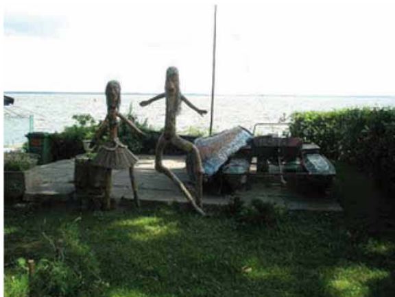
Två förrymda häxor från Witches hill (Raganos kallnas)? – Juodkrantė strandpromenad vid Kuriska sjön.