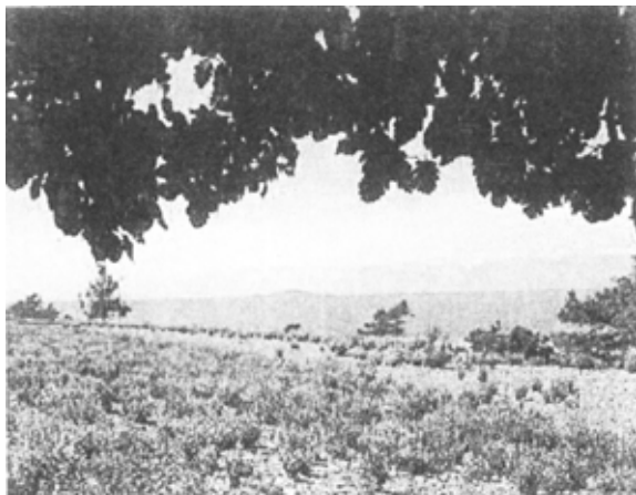
Under Oxeln vid Haget – Norra Ölands västra stenkust