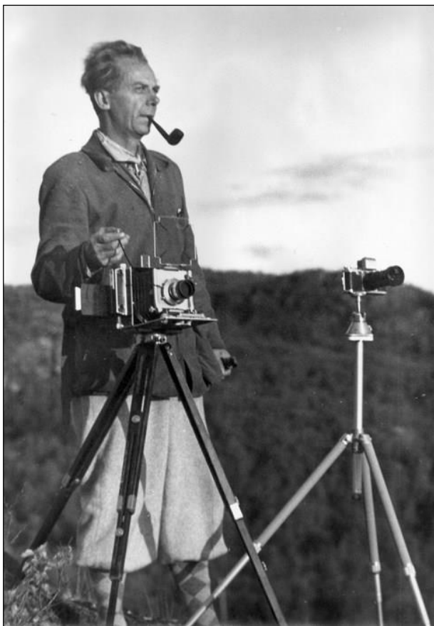
Bernhard Nordh skrev 27 romaner men var också en uppskattad fotograf.

- Jag tycker nog att det är romanerna i fjällmiljö som är bäst, säger Lars Furuland.