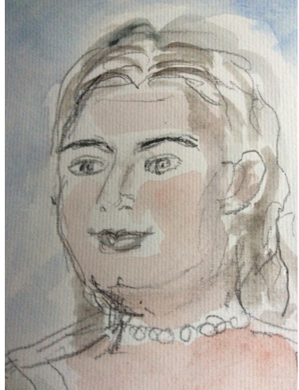
(Hedda) Hedvig de la Gardie 1761-1832