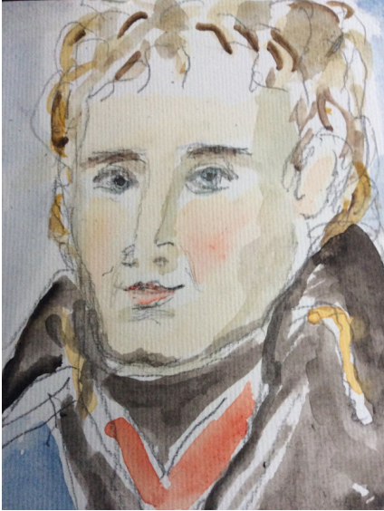
Gösta Gustav M Armfelt 1757-1814