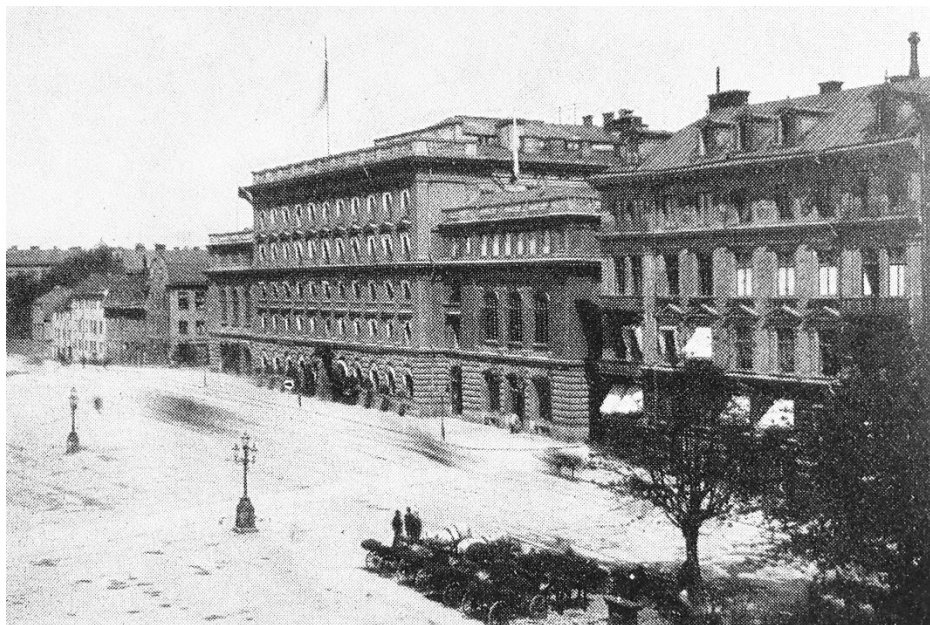
Hôtel Continental år 1890, med flaggan hissad. I salen i högra flygeln stiftades föreningen.