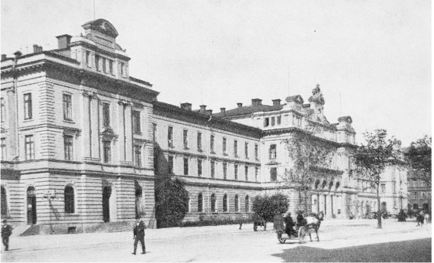
Centralstationshuset Stockholm år 1890; t. h. skymtar annexet. Många av medlemmarna år 1890 hade sin verksamhet i dessa byggnader.

B land personer, som ha samma eller likartad verksamhet, har ofta kunnat förmärkas ett behov att sluta sig samman. Det är en företeelse, som kan skönjas i människors strävan att komma i förbindelse med varandra, i att stammar bildas och nationer uppstå. Under alla tidsåldrar, från den grå forntiden till våra dagar, ha människorna utnyttjat de förhandenvarande kommunikationerna för erhållande av dylik förbindelse sins emellan. Sålunda ha vägarna, enkannerligen järnvägarna, framförallt tjänat behovet av sammanslutning. För alla dem, som arbeta i järnvägarnas tjänst, ligger det därför alldeles särskilt nära till hands att följa det stora föredömet: att sammansluta sig – att bilda förening.