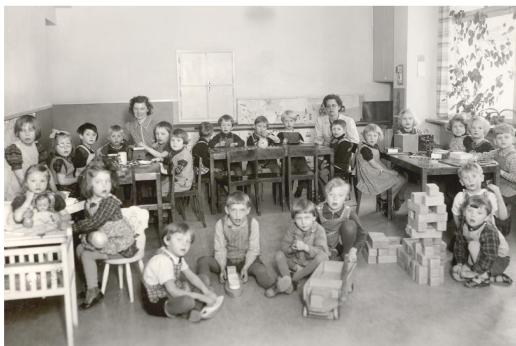
En grupp ungar

tillbringade jag några dagar i en kindergarten av tysk modell. Det var inte roligt! Man skulle leka och vara glad på bestämda tider. Viktigast av allt tycktes vara att man måste sova ett tag mitt på dagen. Då drog man för gardinerna, tog fram någon sorts liggunder lag och sa: ”Nu måste ni vara tysta och sova!” Jag tyckte att det var slöseri med tid, när man i stället kunde ha lekt själv i lugn och ro. Mamma blev ganska fort kry igen så jag slapp eländet med beordrad lek och sömn.